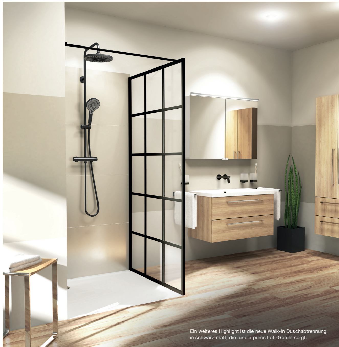
Ein weiteres Highlight ist die neue Walk-In Duschtrennung in schwarz-matt, die für ein pures Loft-Gefühl sorgt.