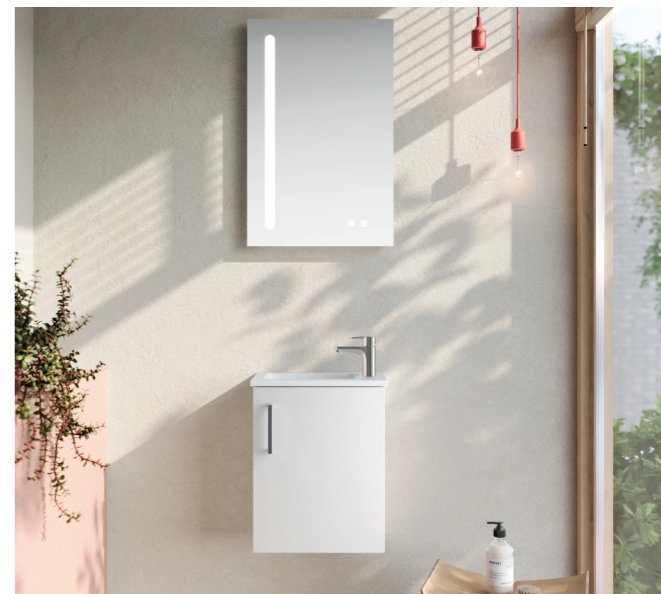
FORMAT Basic Gäste-WC Set