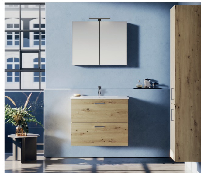
FORMAT Basic Badmöbel